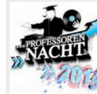
Professorenacht Berlin 2014 Mein Prof. ist ein DJ! am 6. November