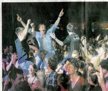
Ausgelassene Stimmung Die Studenten feiern mit ihren Dozenten

die DJane ihren Studenten ein. Überhaupt geht es bei der Veranstaltung viel weniger um die Fähigkeiten der Dozenten, die Technik richtig zu bedienen, es geht einfach um Spaß. Im Zweierduell treten die Profs gegeneinander an. Am Ende ihres Auftritts wird jeweils die Lautstärke des Beifalls gemessen.